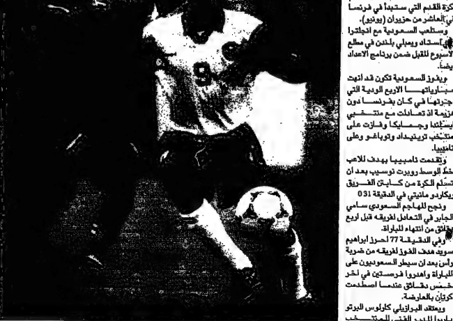
الرياض من عيسى الجوكية

في بطولة كأس العالم في قطر، تمكن اياكس من التغلب على منافسيه في جميع مبارياته، مما جعله يتصدر الترتيب في جميع مبارياته. وهذا الفوز يعد إنجازاً هاماً للمصريين في هولندا، خاصة في ظل المنافسة الشديدة من قبل الأندية الهولندية الكبار.